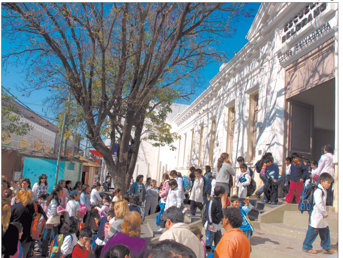
▲ PERJUDICADOS. Los chicos salen de la escuela luego de sólo media jornada de clases. El conflicto docente sigue trabado.